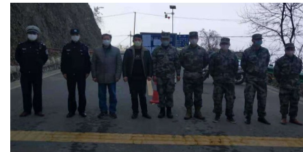
可爱人的防疫工作者

这个年，咱们村的书记和村干部可忙坏了，为了让大家更快了解疫情防疫知识，提高防范意识，各个村镇采取大喇叭广播、巡逻队喇叭车、入户宣传等各种接地气的方式让村民了解最新的疫情进展和防护措施。