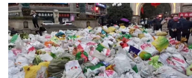
我们乡自发为小溪塔小区市民捐赠新鲜的蔬菜