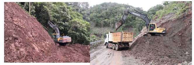
提巴格水电站进场道路施工

疫情防控，项目建设两手抓，同步有序推进。上下同欲者胜，风雨同舟者兴，疫情虽给我们带来了恐惧，只要我们众志成城、戮力同心，没有一个冬天不可逾越，没有一个春天不会来临。